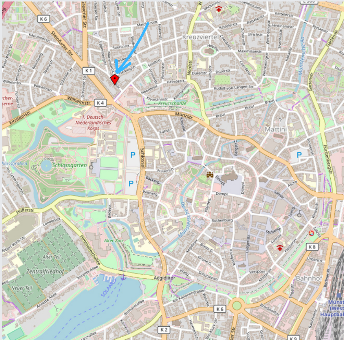
Karte hergestellt aus OpenStreetMap -Daten | Lizenz: Open Database License (ODBL)

IMMOBILIE | LAGE | FOTOS | FLÄCHE/GRUNDRISSE | AUF EINEN BLICK | ANSPRECHPARTNER